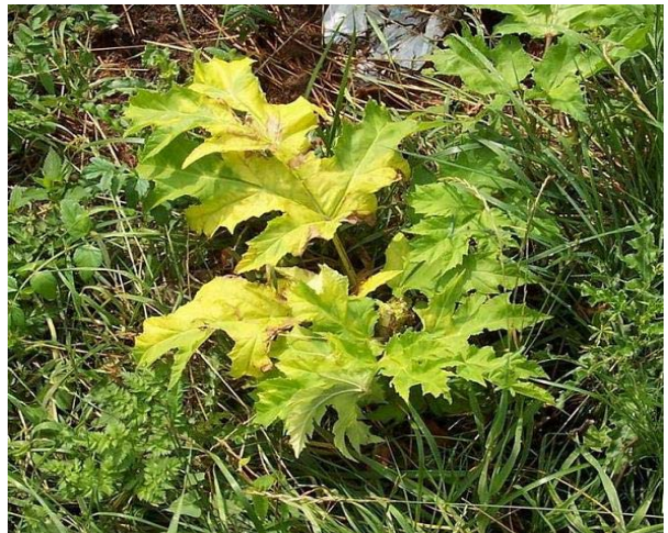
8 Tage nach dem Streichen