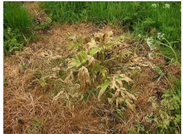
Schäden in der Grasnarbe durch Spritzen von Glyphosat

Bei vorhandener Grasnarbe muss dieser Wirkstoff besonders gezielt eingesetzt werden, da schon wenige Tropfen die umliegenden Gräser schädigen und damit Platz und Licht für am Boden liegende Samen schaffen.