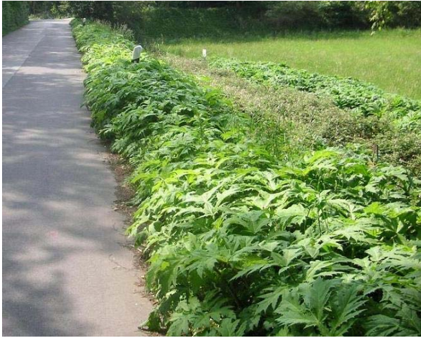
Ausbreitung trotz zweimaliger Mahd pro Jahr im Ruhrtal bei Witten, Foto: Frank Reichel