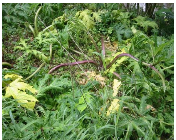
Typische Symptome 1-2 Wochen nach Triclopyr-Behandlung, Foto: Holger Scherhag

Sind die Stauden für eine Behandlung schon zu hoch, kann vorher gemäht und dann der Neuaustrieb behandelt werden. Wird erst kurz vor der Blüte gemäht, dann wachsen nur Notblüten nach und es fehlt die Blattmasse für eine chemische Behandlung.