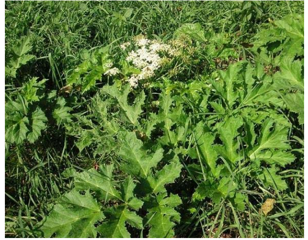
Kaum sichtbare Notblüte nach der dritten Mahd der Wiese